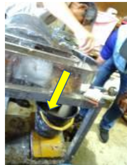
樹皮の排出(取出し)