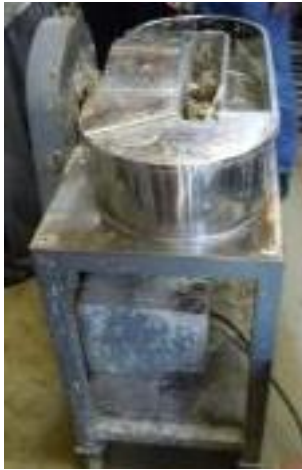
ビーター掛け機全景

明石市でケナフ ビーター掛け作業を行いました。 KSCケナフの会メンバーと合わせて8名が参加しました。 作業の状況を写真で報告致します。