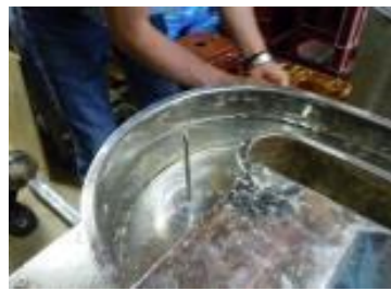
ビーター機水路に水張り