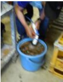
短く切った ケナフ樹皮を水に浸す