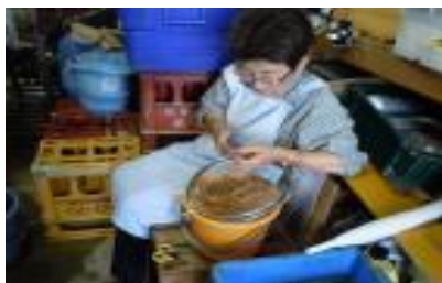
ケナフ樹皮に水切り