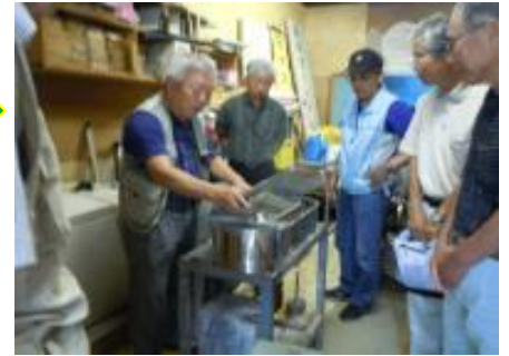
使用方法の指導を受けました