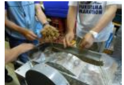
水に浸したケナフ樹皮を ビーター機水路に入れる