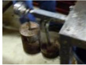
刃の隙間調整用の錘