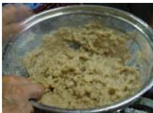
洗浄後のケナフ樹皮